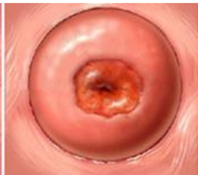
Rød plet og irritation

Sådan ser livmoderhalsen ud. Ved den gynækologiske undersøgelse er livmodermunden rød, irriteret og blødende ved berøring. Vævsprøverne viser som regel inflammation, som er en irritationstilstand.